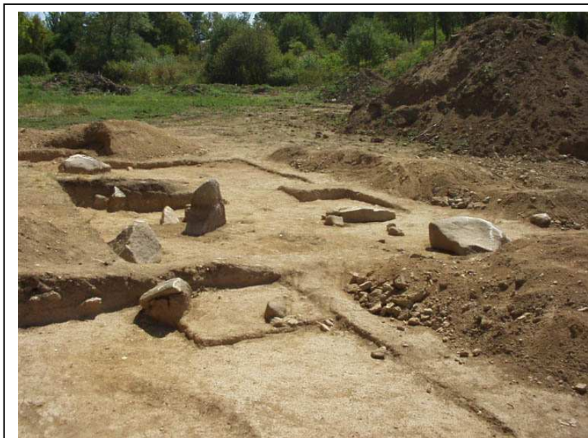
Stav naleziště po vykopávkách -, 16.8.2003

- Po určité době jsem já osobně hovořil s technikem, provádějícím analýzu domnělého jadeitu. Teprve později prokázal skutečný charakter materiálu hranolů, tedy akrylát. Nijak se nepozastavil nad skutečností, že nebyl akrylát rozpoznán hned po nález. Podle něj se jednalo o velmi autenticky vyhlížející nález, imitující minerál jadeit. Pod tímto dojmem se nikdo neodvážil provést jednoduchou zkoušku ožehnutí materiálu plamenem. Akrylát by se přirozeně vlivem otevřeného plamene přiškvařil, což by u jadeitu nenastalo. Vzhledem k malým rozměrům hranolů - kolem 4 cm - se nedala hodnotit na dlani ani hmotnost materiálu. Nález těchto artefaktů tedy mohl snadno mystifikovat i sběhlé odborníky.