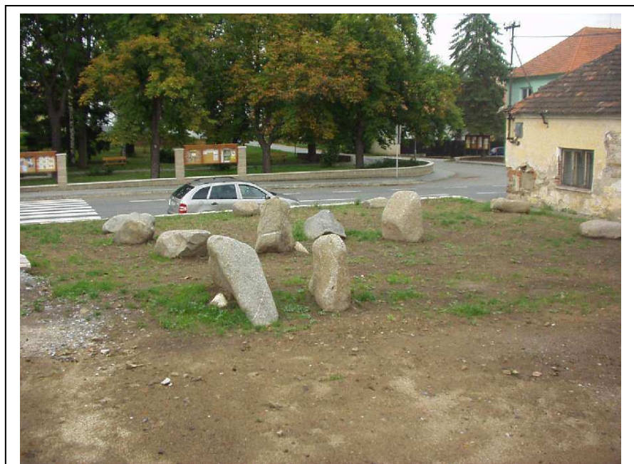
Rekonstrukce kamenné sestavy uprostřed obce