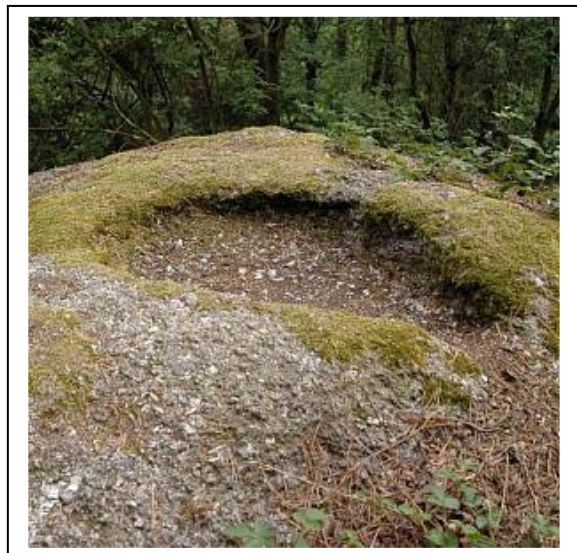
Klepec ční nad okolní rovinou.

Barbarské germánské kmeny dorazily v průběhu 1. století také do nitra Čech. Válečníky provázeli i kněží a šamani, kteří byli zběhlí v různých rituálech, jimiž uctívali své bohy. Germánští duchovní neměli žádné kostely nebo chrámy, k obřadům si vybírali místa pod širým nebem, typicky na pahorcích, v hlubokých lesích či u pramenů vod a jezírek.