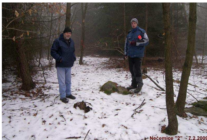
Nečemice "2" - 7.2.2009