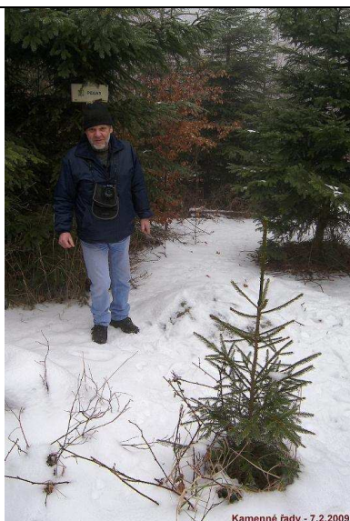
Kamenné řady - 7.2.2009

Na náš podnět se uskuteční v průběhu února 2009 zaměření kounovských, nečemických řad a Klučku do jednoho bodu v obci Lipno v rámci diplomové práce na Katedře matematiky ZČU v Plzni. (První akce 7.2.2009 – označení kounovských, nečemických řad)