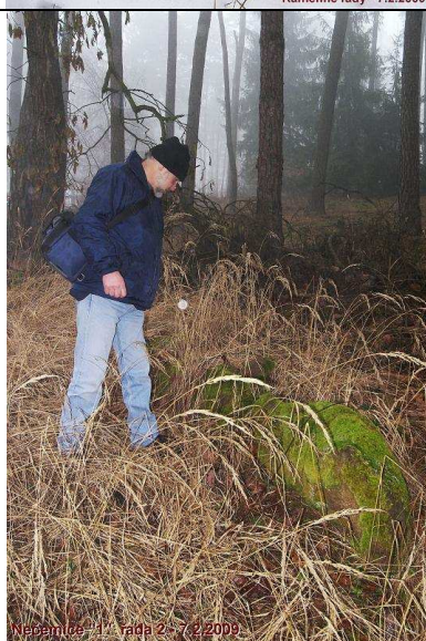
Nečemice "1" - řada 2 - 7.2.2009