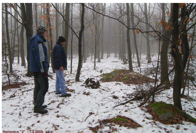
Nečemice "2" - 7.2.2009