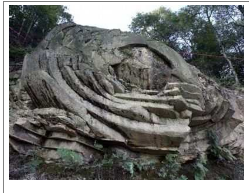
když v lese sbíral dříví.